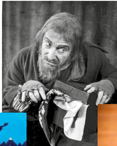
F' dan il-programm ser nitkellmu fuq l-istejjer tal-musicals.