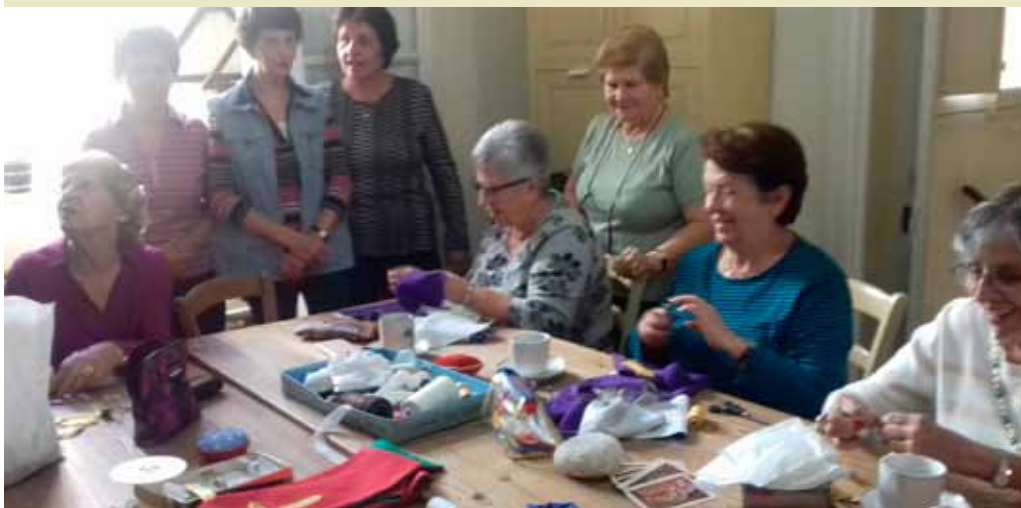
Il-grupp Pia Opera dei Tabernacoli.