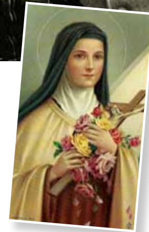
San Louis u Santa Zelie Martin, il-ġenituri Qaddisa ta' Santa Tereza tal-Bambin Ġesù